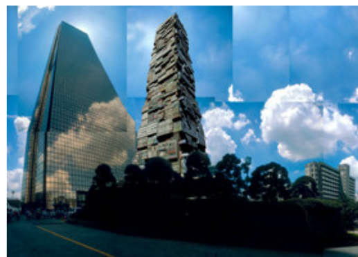
Kolkoz Tower Séoul, Yoido, 2005