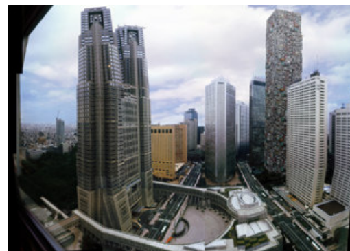
Kolkoz Tower , Shin Juku, City Hall, 2005